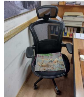
Ad 9 Stolica uredska