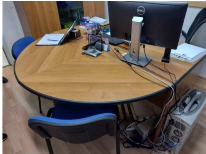
Ad 7, 15 i 16 Monitor LCD, Uredski stol i Stolica