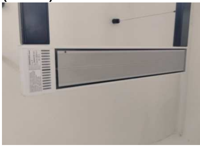
Ad 5 Stropni uređaj za grijanje (6 kom)