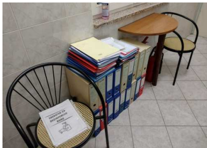
Ad 4 Namještaj za predsoblje