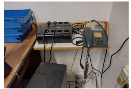
Ad 6 Stalak za telefon