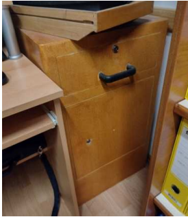
Ad 2 Kasa