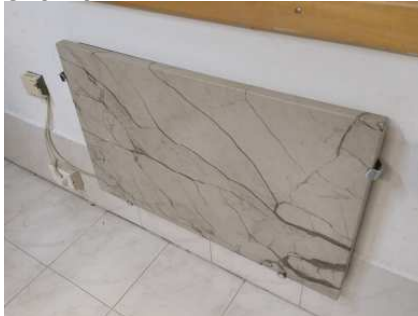
Ad 2 Mramorne ploce za grijanje (2 kom)