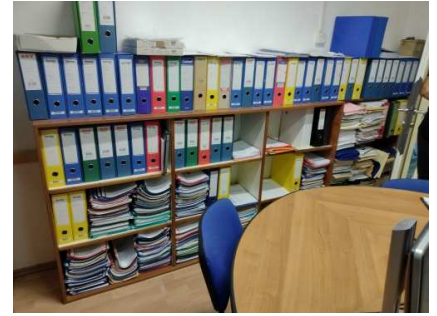
Ad 3 Stalaža drvena