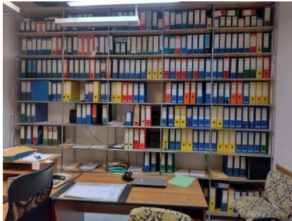
Ad 8 Polica I