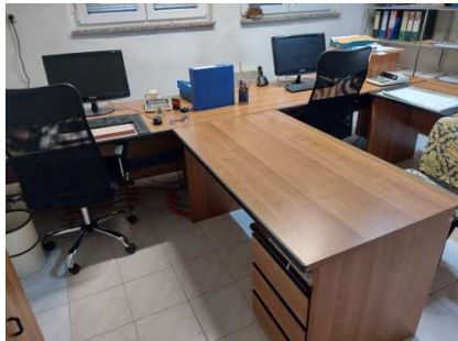
Ad 11 i 12 Uredske stolice i Stolovi