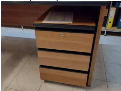
Ad 13 Uredski ladičar sa 3 ladice (2 kom)